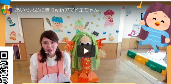
あいうえおにぎり