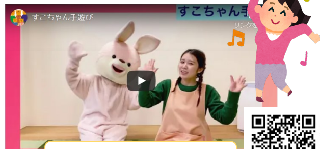
すこちゃん手遊び